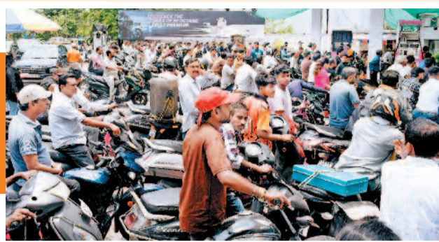
धक्का लगाकर पंप तक पहुंच रहे वाहन चालक