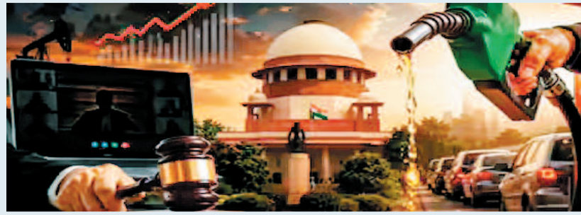
कार पलिंग करने सहमत हुए जज : रजिस्ट्री को निदेश दिया गया है कि वीडियो लिंक समर्थ पर भेजे जाएं और तकनीकी व्यवस्था सुचारु रखी जाए ताकि न्यायालय के कामकाज में कोई बाधा न आए। ईंधन के बेहतर उपयोग के उद्देश्य से सुप्रीम कोर्ट के माननीय जजों ने आपसी सहमति से कार-पलिंग को प्रोत्साहित करने का निर्णय लिया है।